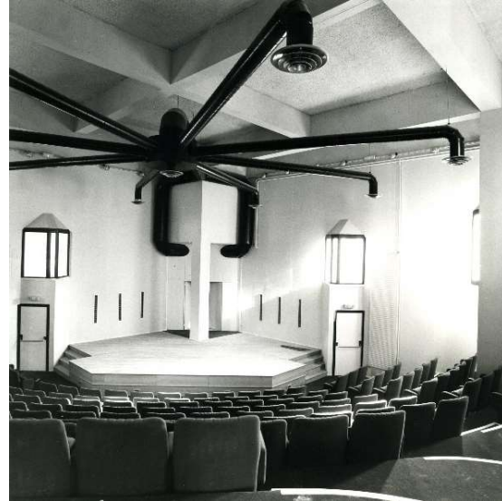
5. Vues de l'auditorium à sa conception.