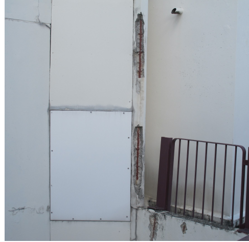
2. Vue de l'auditorium et des bétons éclatés. Photos Serge Kalisz, 2016.