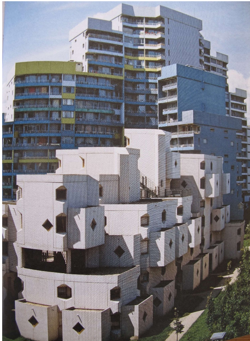
4. Vue d'ensemble du foyer Maurice Ravel et des logements conçus par Jacques Kalisz. Photographie Robert Doisneau, mission photographique de la DATAR, années 1980.

1. Appréciation technique : L'édifice constitue un exemple réussi d'utilisation de la préfabrication en béton (entreprise Coignet), en correspondance avec la modularité des éléments.