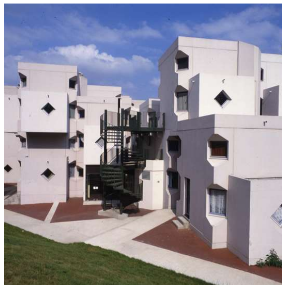
6. Vues extérieures des assemblages volumétriques.