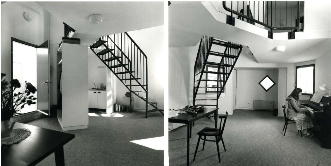
3. Vues intérieures d'un logement.