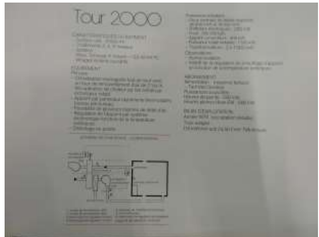
Tour 2000 001- Publication EDF 1980