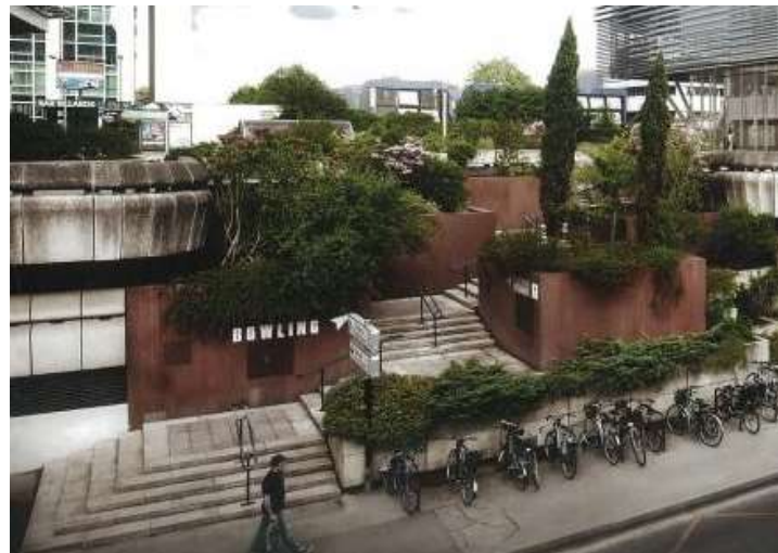
006 Solidarité Gironde : l'escalier de la rue Corps-Franc Pomiès

Un escalier sera réalisé pour accéder directement à l'immeuble depuis la rue Corps Francs Pomiès.