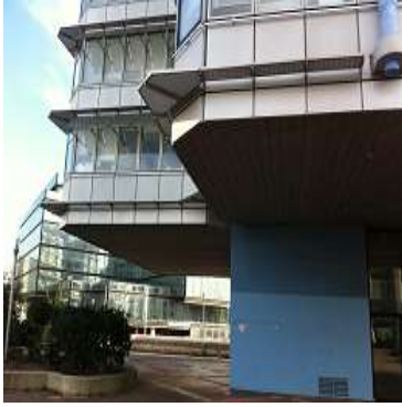
003 Solidarité Gironde