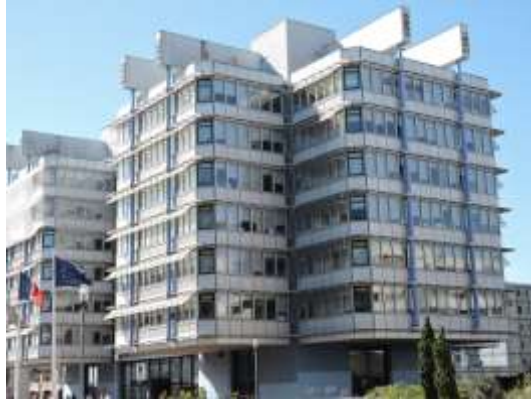
002 Solidarité Gironde Photo Sauvegarder Mériadeck

Le parti constructif de l'immeuble est exprimé en façade: les parties en porte-à-faux sont suspendues à de grandes poutres émergeant du bâtiment, par de larges tirants en acier. Un capotage acier et leur couleur (initialement rouge, et aujourd'hui bleu) les sur-expriment. Ce parti constructif permet en outre de libérer les façades et les espaces intérieurs des branches des croix.