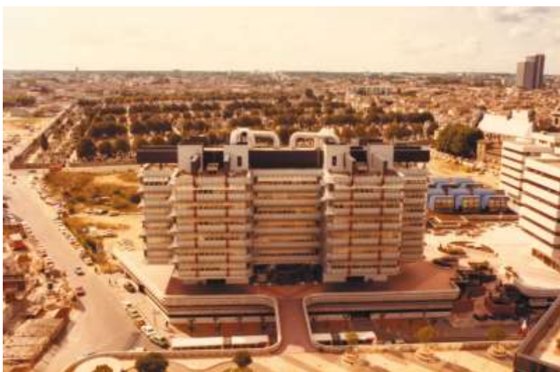
001 - Solidarité Gironde - la DDASS à sa construction