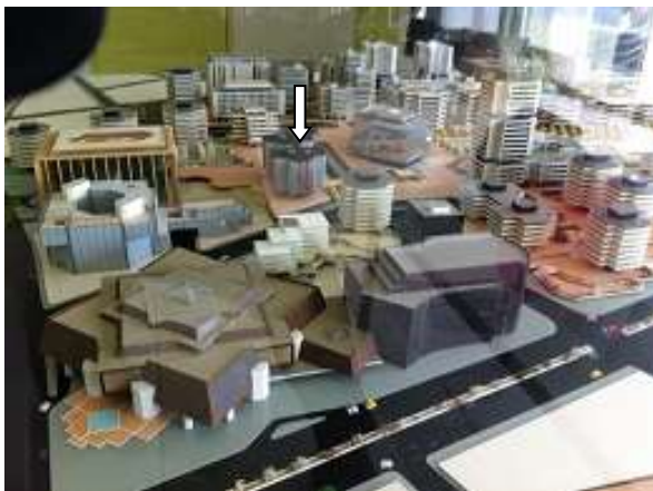
008 Solidarité Gironde Maquette Royer/Willerval

Tous les projets de construction d'immeubles étaient soumis à l'appréciation et à l'agrément de Jean Willerval. La présence de Solidarité Gironde sur la maquette exposée dans le Centre d'Information en 1970, atteste de la liberté d'interprétation que Jean Willerval a bien voulu laisser aux architectes. Tout en respectant la double croix latine, ils ont pu faire preuve d'une grande originalité.