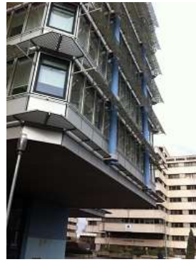
004 Solidarité Gironde