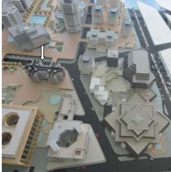
010 Solidarité Gironde Maquette Royer/Willerval