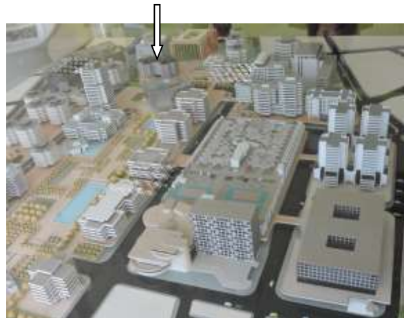
009 Solidarité Gironde Maquette Royer/Willerval