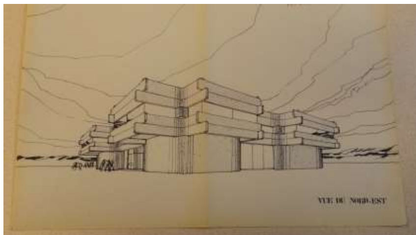
La Pagode 003

Il donne l'impression que l'architecte Jean Willerval s'est amusé et s'est en même temps fait plaisir en construisant un immeuble de taille réduite mais qui est un modèle de l'architecture du quartier.