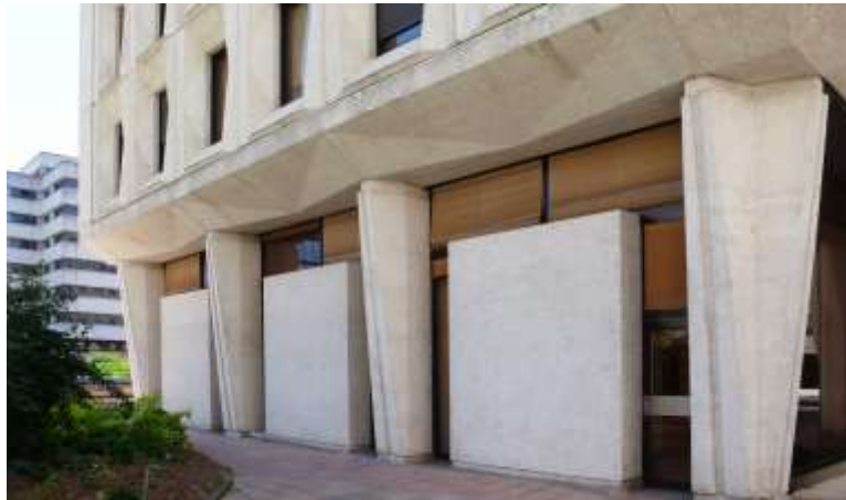
Horizon 1 (Ociene) - Le péristyle de la taille de guêpe

La façade du rez-de-rue a été remaniée, pour créer une deuxième entrée: un ensemble d'habillages en métal, teinte naturelle, encadrant de grandes baies vitrées a été mis en place, ainsi que de grands ensembles de grilles en métal. Le bâtiment est composé d'un noyau central, relié à une façade porteuse en éléments de béton préfabriqué par des poutres transversales. Chaque élément préfabriqué à une largeur de 2,70 m. Les planchers ont été préfabriqués. L'espace du rez-de-chaussée a été soigné: un majestueux escalier en pas-de-vis trône à côté de la banque d'accueil, des cloisonnements en bois vernis organisent les espaces. Les propriétaires mettent un point d'honneur à conserver les aménagements d'origine.