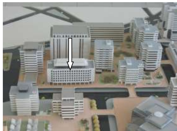
Maquette Bordeaux Métropole