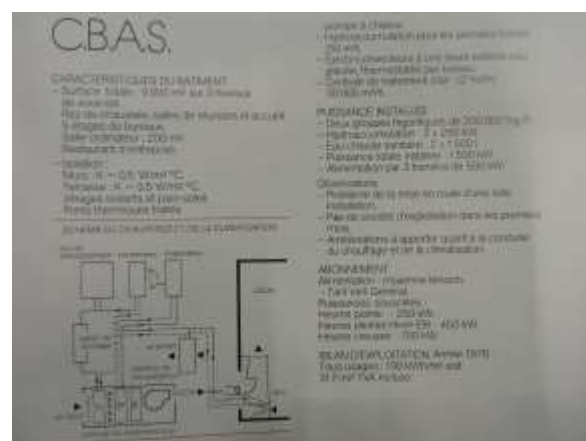
Ociene 003 - Publication EDF 1980