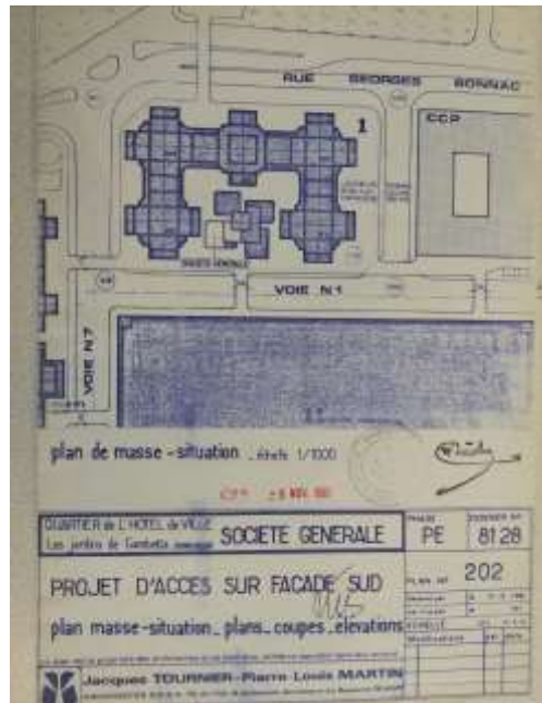
Les Jardins de Gambetta 002

Les corps de bâtiments présentent une interprétation de la taille de guêpe, pincement au niveau de la dalle, que l'on retrouve sur les immeubles du Ponant : les surplombs sont soutenus par des demi-arcades dans les parties extérieures des bâtiments, et par des arcades dans les parties intérieures, formant ainsi les patios d'inspiration méditerranéenne voulus par l'architecte Salier ; ils créent une symétrie parfaite d'un bâtiment à l'autre.