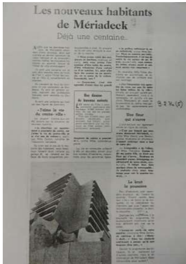
Les Jardins de Gambetta 003

Les architectes urbanistes avaient également prévu l'installation de commerces sur cette partie de la rue Georges Bonnac qui avait été élargie dans ce but. La dalle reste pratiquement inaccessible par la rue Georges Bonnac, ce qui créé au pied des immeubles des Jardins de Gambetta, de l'hôtel Mercure et de la Tour Paul-Victor de Sèze des zones sans entretien et qui ne sont pas utilisées par les usagers de la dalle.