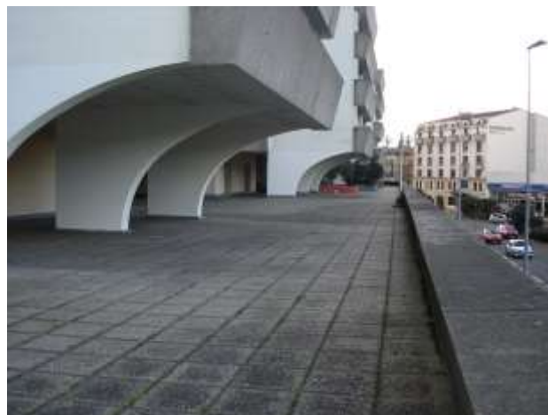
Les Jardins de Gambetta

Les corps de bâtiments présentent une interprétation de la taille de guêpe, pincement au niveau de la dalle, que l'on retrouve sur les immeubles du Ponant : les surplombs sont soutenus par des demi-arcades dans les parties extérieures des bâtiments, et par des arcades dans les parties intérieures, formant ainsi les patios d'inspiration méditerranéenne voulus par l'architecte Salier ; ils créent une symétrie parfaite d'un bâtiment à l'autre.