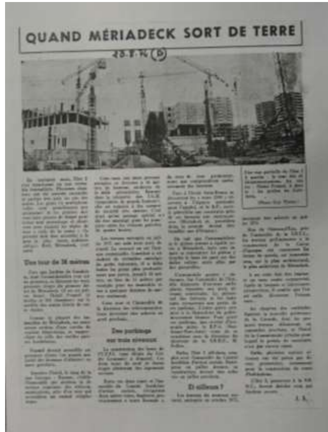
Les Jardins de Gambetta 001 - Journal Sud-Ouest 28 août 1974

PC 74 Z 0045 (refusé) pour la construction d'un immeuble rue Georges Bonnac en face des Jardins de Gambetta car la construction est incompatible avec le quartier moderne. Il est prévu en 1970 une extension de la dalle entre l'entrée de la rue Charles Marionneau et l'entrée de la rue du Petit Goave.