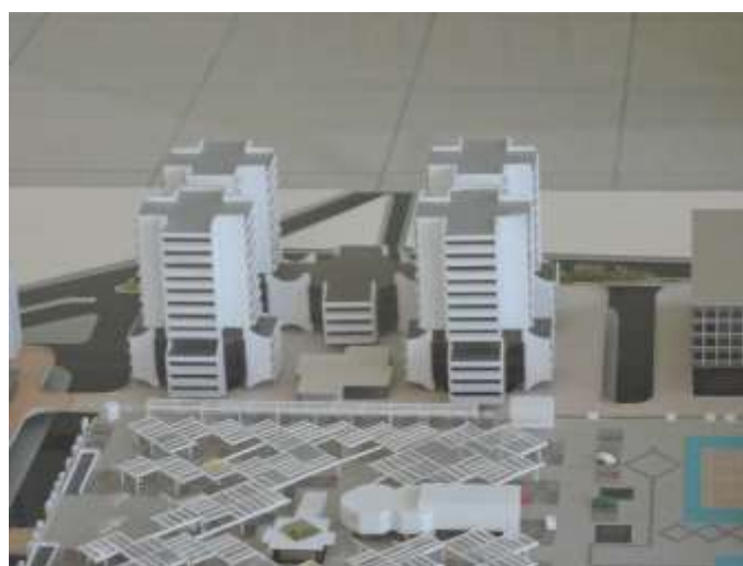
Photo Sauvegarder Mériadeck - Maquette