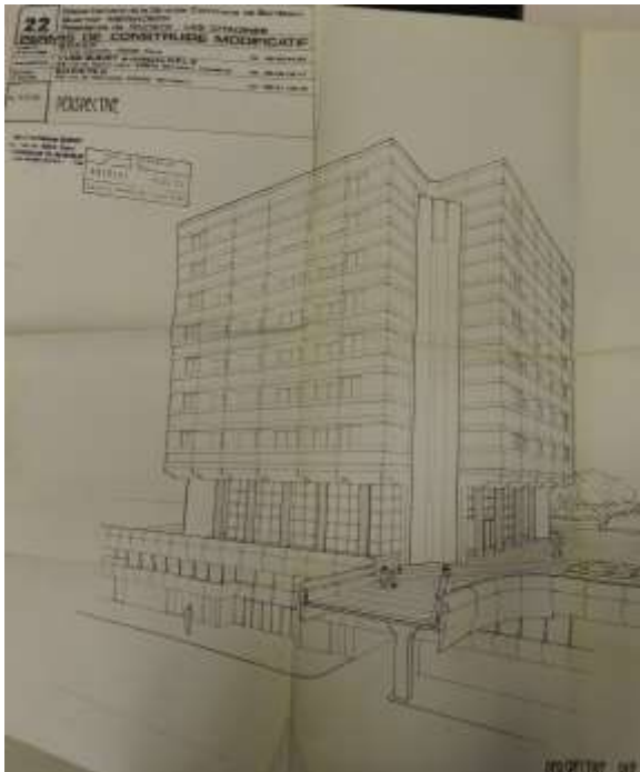
Les Citadines 001

Il possède 7 niveaux sur la dalle pour une hauteur totale de 43,24 m NGF, le dernier plancher étant à 39,29 m NGF.