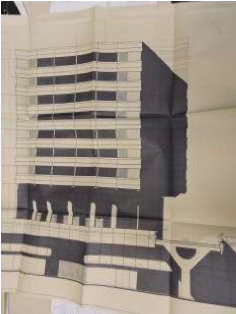
Les Citadines 003

L'alternance des couleurs des matériaux accentue l'horizontalité des lignes imposée par le cahier des charges du quartier.