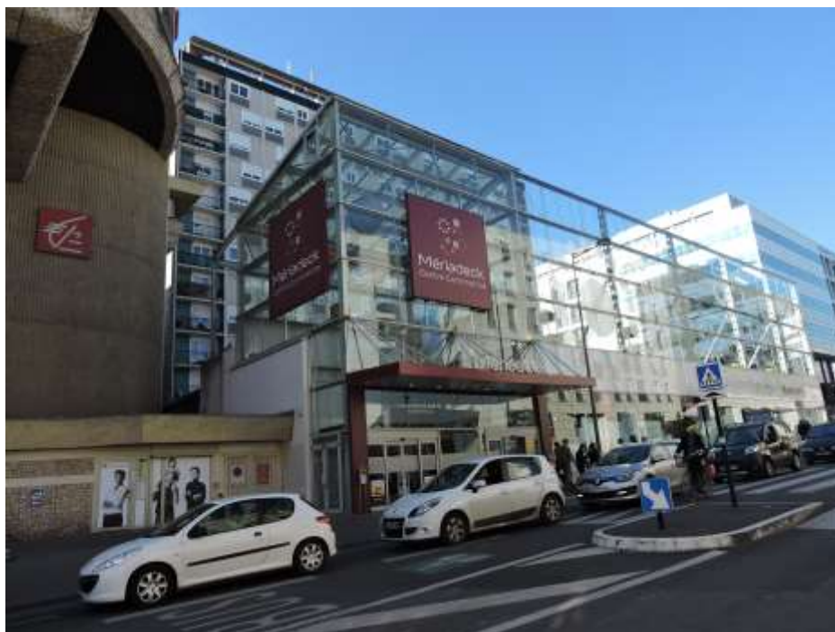
La verrière aujourd'hui

En 1993, la banque est remplacée par des commerces. La verrière qui couvre le mail d'accès à la galerie commerçante masque totalement le Résidence du Château d'Eau et casse la perspective qui permettait d'avoir une vue d'ensemble de la Caisse d'Epargne.