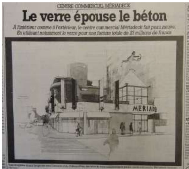
Commerces 002 Angle rues Château d'eau / Père Dieuzaide

1993: une verrière vient s'appuyer sur cet aménagement, masquant presque totalement la partie Ouest de la Caisse d'Epargne. L'entrée du centre commercial par la rue Père Dieuzaide est fermée.