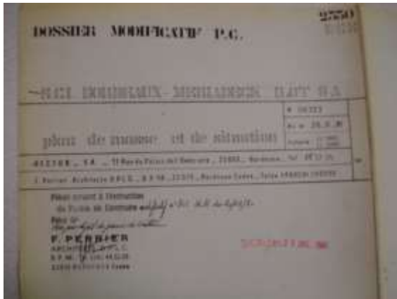
Le Cardinal 001