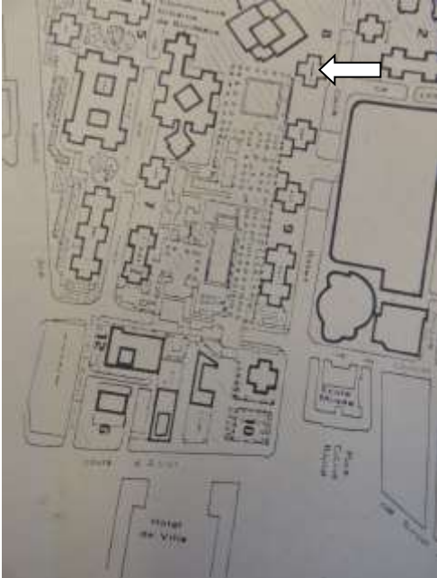
Le Cardinal 003