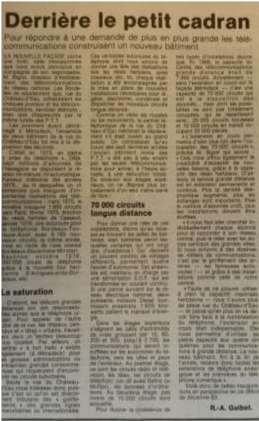
Tour de Sèze 002