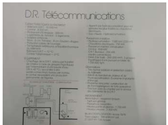
Tour de Sèze 004 - Publication EDF 1980